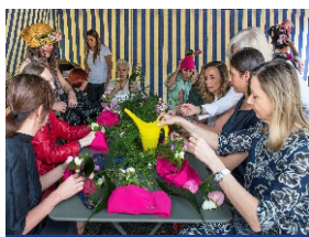
manualità & creatività