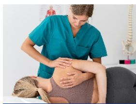
fisioterapia & osteopatia