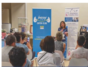
seminari & incontri

Le terapie mettono a dura prova il fisico e spesso non è facile per le pazienti guardarsi allo specchio e ritrovare sé stesse; è difficile anche rilassarsi, sopportare i dolori, superare la stanchezza, accettare il fatto che è tutto diverso, tutto è cambiato. È difficile organizzare i pasti, scegliere i piatti giusti e ricominciare a cucinare per la famiglia. Non è facile sentirsi di nuovo bene nel proprio corpo, rimettersi in forma e ritrovare la forza fisica, superare i momenti più duri. La «Casa delle Libellule» diventa quindi uno spazio dove ritrovarsi in cui, oltre ai servizi socio-sanitari, si alternano appuntamenti da mettere in calendario realizzati in collaborazione con esperti e specialisti per contrastare gli effetti collaterali delle terapie oncologiche, ma anche seminari e workshop, corsi e lezioni per imparare, attività sociali, ricreative e manuali mirate al recupero della vita. Vogliamo che tutte le Libellule possano rinascere e riprendere il volo.